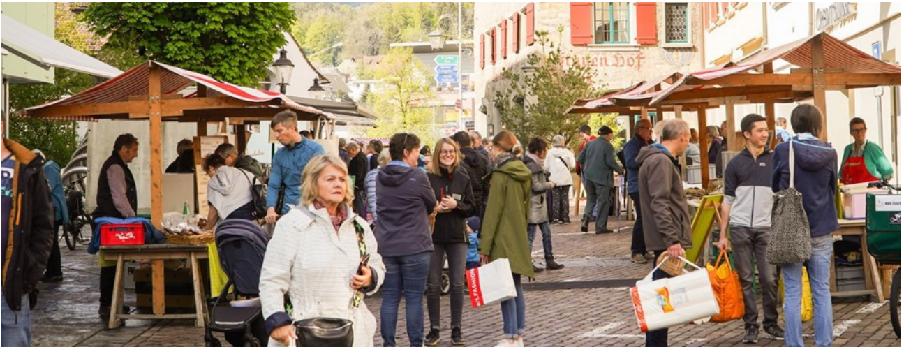
Der Buuremaart findet am Samstag zum letzten Mal in diesem Jahr statt.