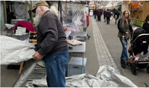
Kobelwald • 04.11.2023